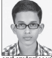
ജെൻ ജോർജ്ജ് കോശി പള്ളിക്കൽ സെന്റ് തോമസ്