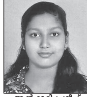
ആൻ ദേരി പ്രദീപ് എനാത്ത് എം.റ്റി.സി.