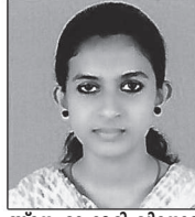
സന്ദേഹാ ദേരി വിനോദ് തേവലക്കര ഹെബ്രോൻ