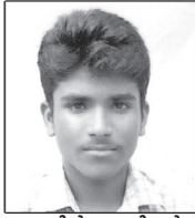
ജെനിൻ ജോയിച്ചൻ മാർത്തോമ്മാ ഗുരുകുലം