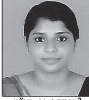
സന്ദേഹാ മത്തായി തേവലക്കര ഹെബ്രോൻ